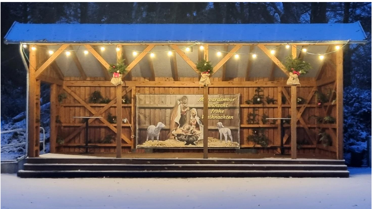
Weihnachtlich: Lüchtermarkt in Marcardsmoor