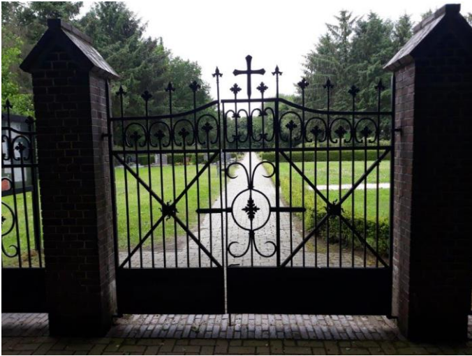
Kreuzkirche zu Marcardsmoor (1907) Schwungvolles Friedhofstor