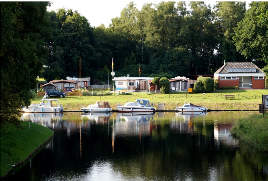
Marcardsmoor Idylle auf dem Kanal