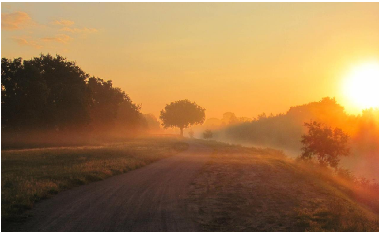
Upschört: Wunderschöne und friedvolle Landschaft, herrliche Radwanderwege