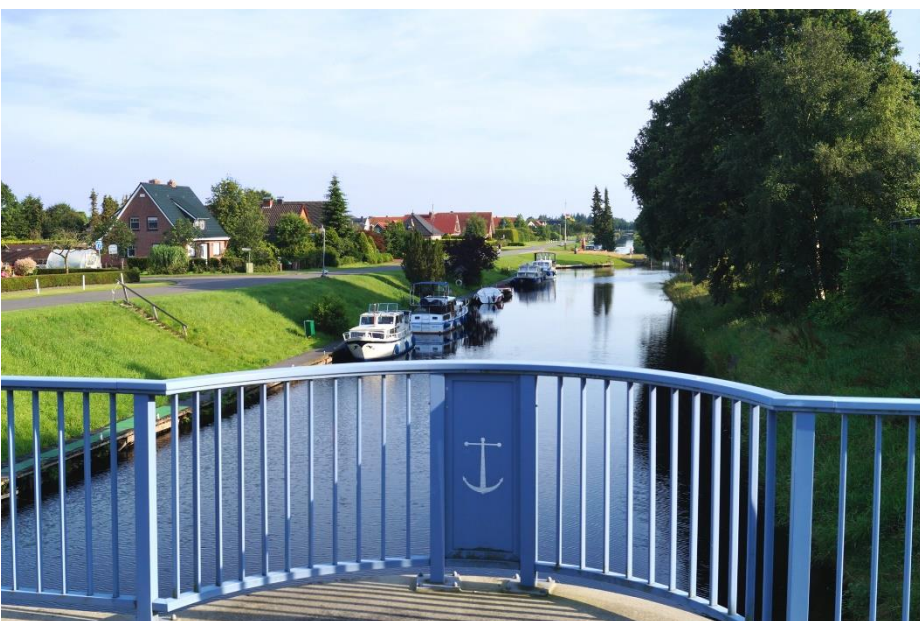
Marcardsmoor Leben am Kanal